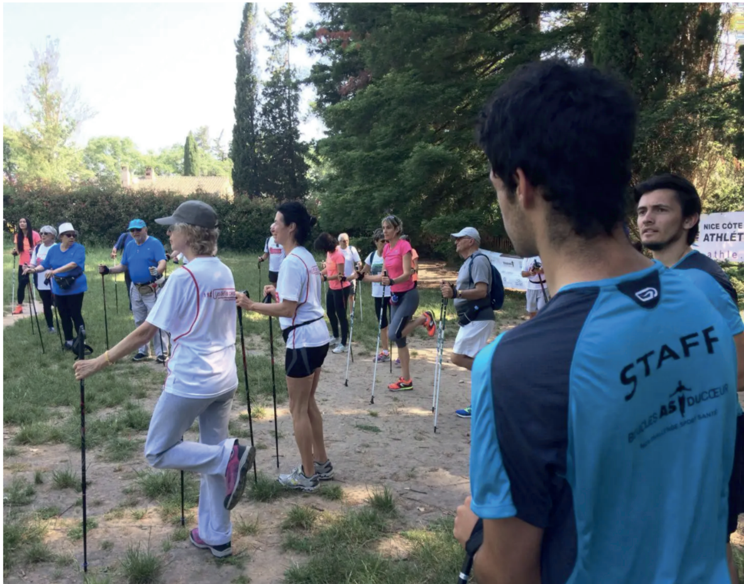
Les malades azuréens et varois pourront bientôt participer à cette expérimentation promue par Azur Sport Santé, qui a fait ses preuves lors des pré-tests.

#COTE-D-AZUR #SANTÉ | PAR NANCY CATTAN | Mis à jour le 21/06/2020 à 09:00 | Publié le 21/06/2020 à 09:00