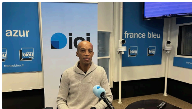
Stéphane Diagana.

Il aura fallu 10 ans pour que l'activité physique adaptée soit remboursée par la Sécurité sociale pour les personnes atteintes de maladies cardio-vasculaires. Un combat mené par des expérimentations sur la Côte d'Azur et également par notre invité, Stéphane Diagana, ex athlète international.